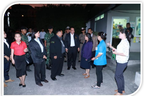
กิจกรรมรณรงค์การเฝ้าระวังและส่งเสริมวันวาเลนไทน์ ณ โรงเรียนชินอรสวิทยาลัย และการออกตรวจร่วม