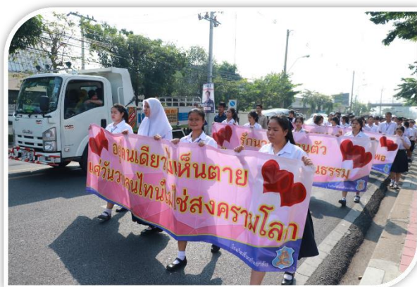
(๒) รมรณรงค์การเฝ้าระวังและส่งเสริมวันวาเลนไทน์