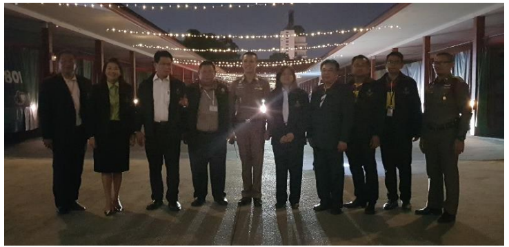
กิจกรรมรณรงค์เฝ้าระวังและส่งเสริมกิจกรรมลอยกระทง ณ โรงเรียนเขมาภิรตาราม และการออกตรวจร่วม