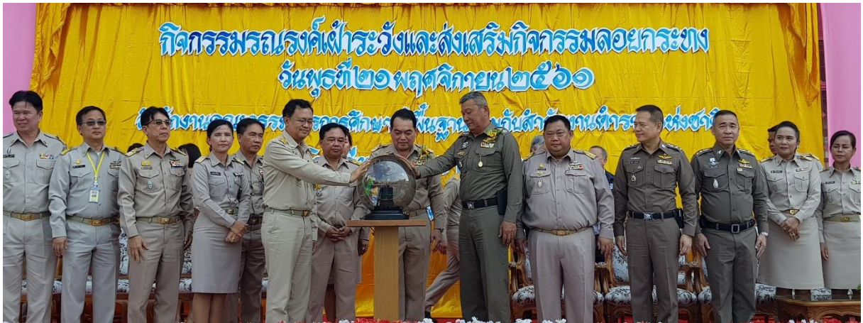
(๑) รมรณรงค์การเฝ้าระวังและส่งเสริมกิจกรรมสร้างสรรค์วันลอยกระทง